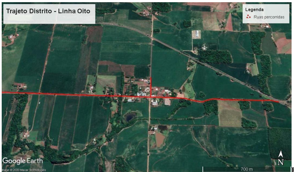
Figura 03: Imagem de satélite indicando o trajeto a ser percorrido - Distrito Linha Oito.