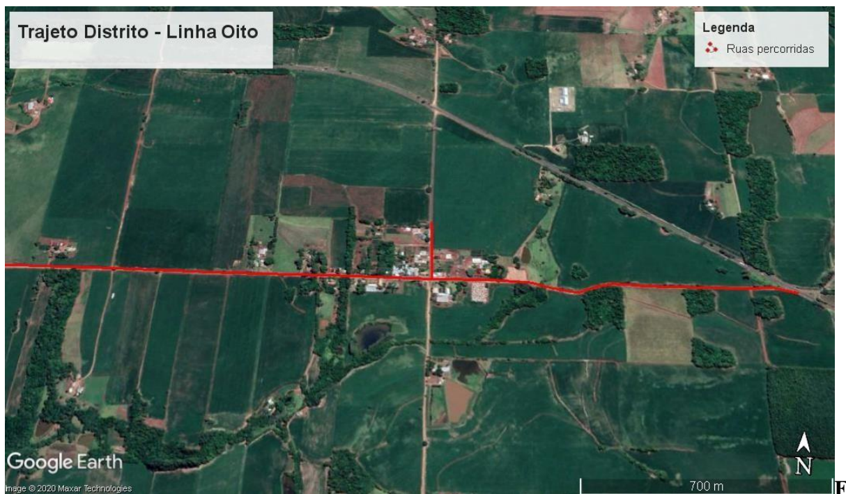
Figura 03: Imagem de satélite indicando o trajeto a ser percorrido - Distrito Linha Oito.