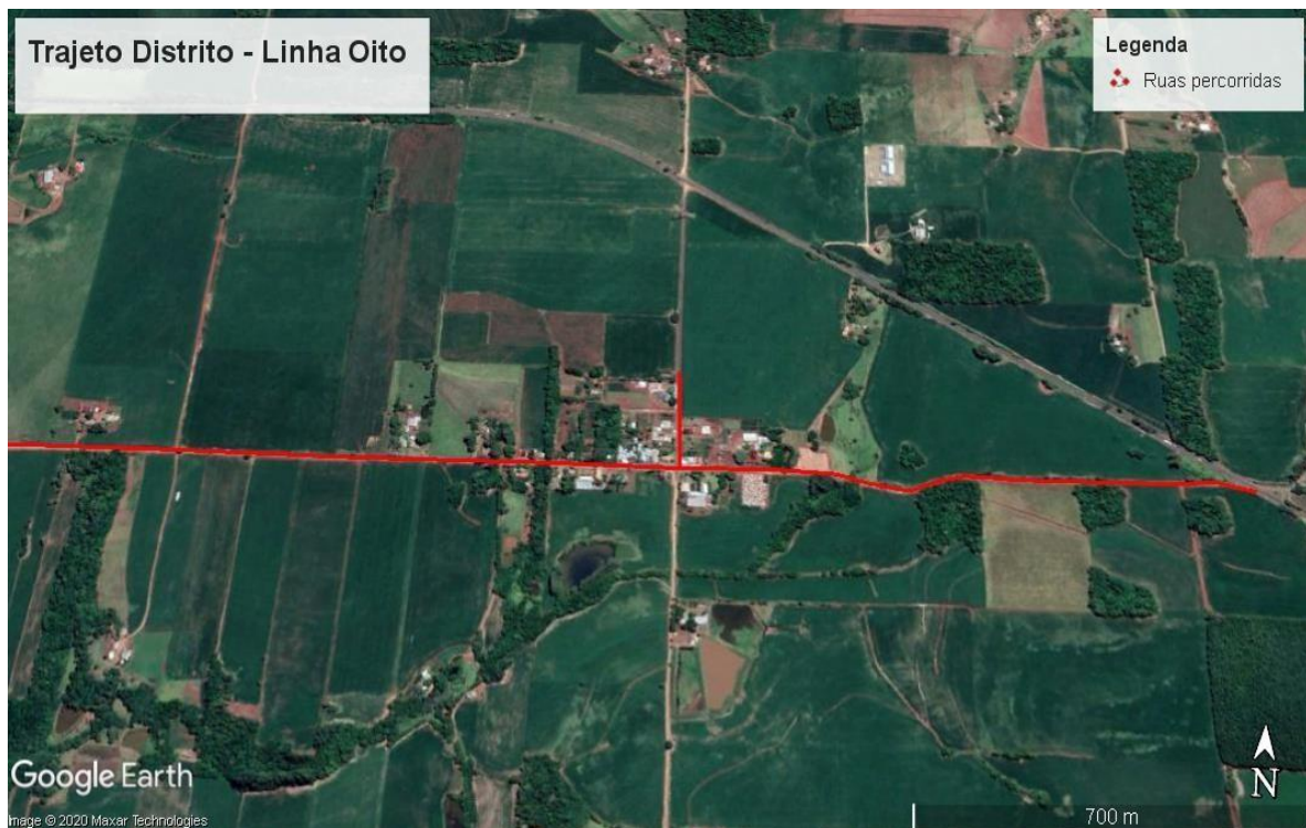
Figura 03: Imagem de satélite indicando o trajeto a ser percorrido-Distrito Linha Oito.