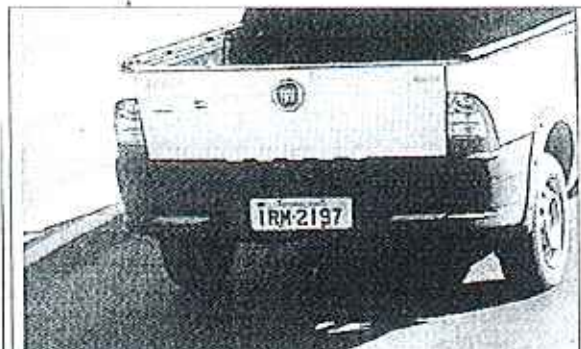
FOTOGRAFIA DO VEICULO AUTUADO LOCAL DO VEICULO AUTUADO MUNICIPIO DO VEICULO AUTUADO DATA DA FOTOGRAFIA NOME DO PROPRIETARIO Nº DO REGISTRO DO VEICULO Nº DO CNH DO CONDUTOR